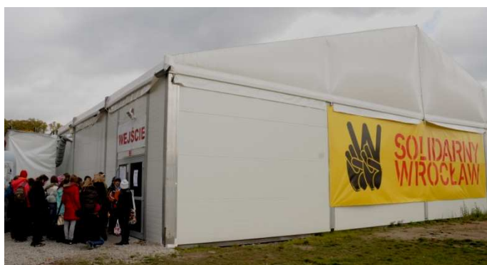
Wystawę odwiedziło ponad 52 tys. zwiedzających

Najważniejszym projektem realizowanym w roku 2010 była wystawa „Solidarny Wrocław”, zorganizowana przez Ośrodek „Pamięć i Przyszłość” na zlecenie miasta Wrocławia. Ekspozycja ta była jednym z głównych punktów wrocławskich obchodów 30. rocznicy powstania NSZZ