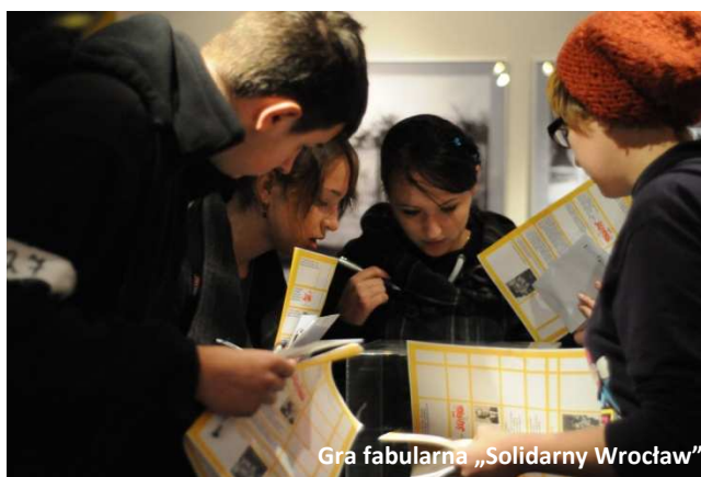
Gra fabularna „Solidarny Wrocław”

– konkurs plastyczny „30 lat Solidarności” skierowany do dzieci z pierwszych trzech klas szkoły podstawowej. Uczniowie mieli za zadanie stworzyć plakat, na którym przedstawią co dla nich oznacza NSZZ „Solidarność” i jej działalność. Wszystkie