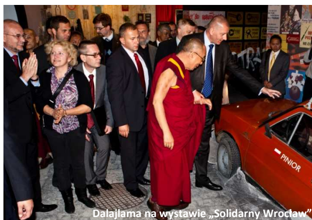
Dalajlama na wystawie „Solidarny Wrocław”